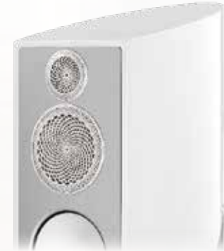
Harmony Hochglanz Weiß