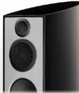
Vanta Hochglanz Schwarz