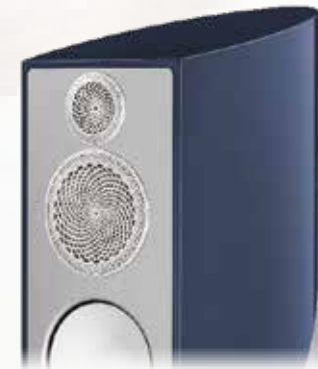
Aria Metallic Blau