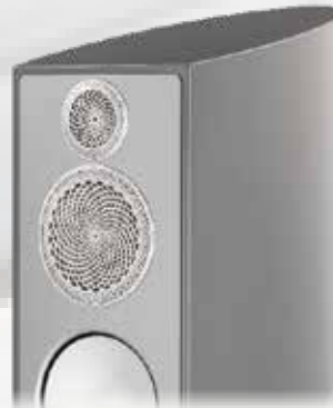
Sonic Metallic Silber